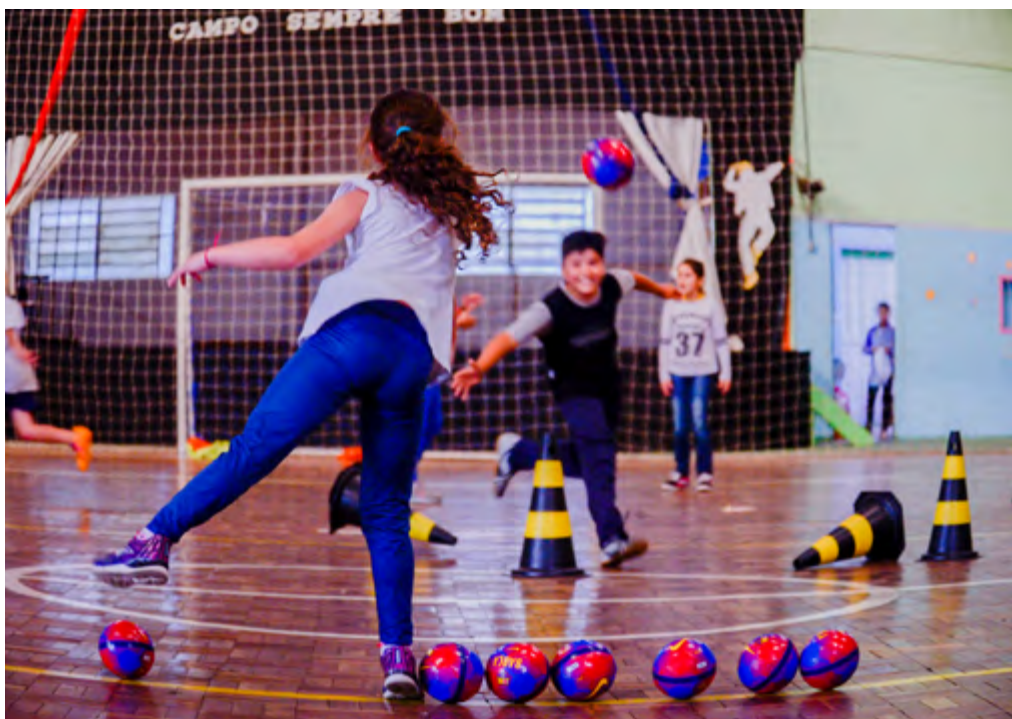
▶ Durante os encontros são desenvolvidas atividades esportivas

O desempenho escolar dos participantes também é requisito importante e, por isso, são desenvolvidas ações semanais de acompanhamento do rendimento na escola e promoção da cidadania. A equipe de trabalho aplica planos e mediação das aulas, oficinas e treinos, e também acompanha a frequência nas atividades do projeto.