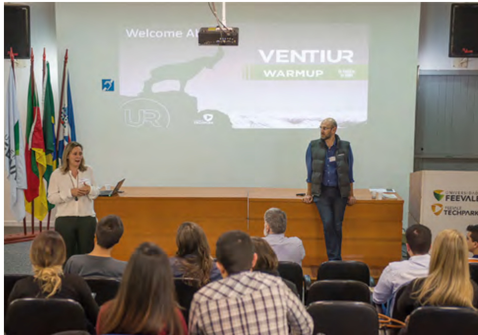
Warmup: processo de pré-aceleração foi realizado em quatro encontros

Sul: Julius , Cobre Fácil e Mobictor Health System , de São Paulo; Pedidos Pro , Doctor Talk e Fancy Jobs , do Paraná; FazGame , do Rio de Janeiro; e GetJus , de Goiás.