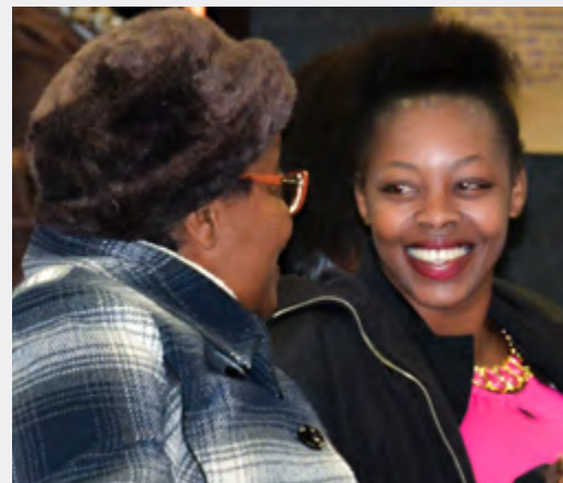
► Atividades incentivam a prática da língua portuguesa