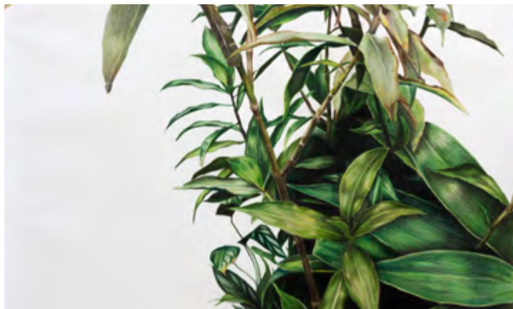
► Obra da artista Amélia Brandelli, Lápis de Cor

cam às linguagens do desenho e da pintura. A intenção da mostra Conversas: desenho e pintura em pauta é estabelecer, a partir dessas produções, uma conversa entre as linguagens, possibilitando a mediação e o debate sobre a amplitude dos conceitos de desenho e pintura na Arte Contemporânea.