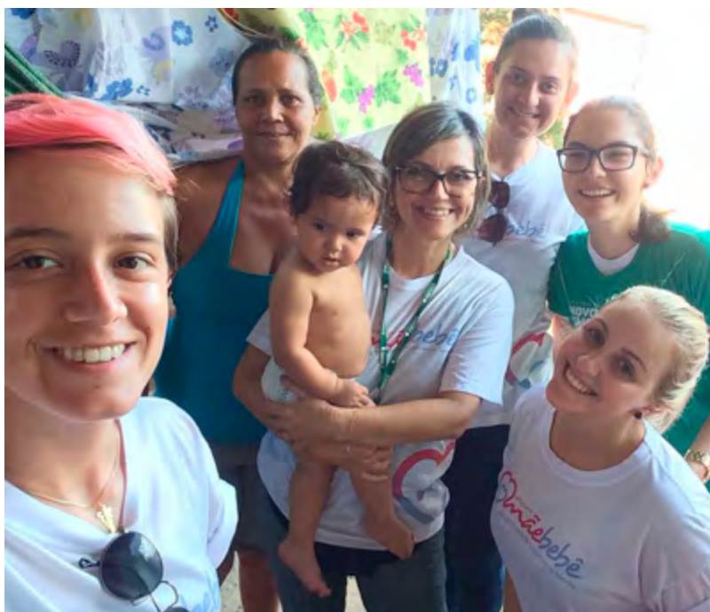
▶ Acadêmicos acompanham mães e filhos no projeto