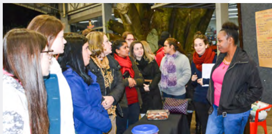
Feira cultural foi uma das atividades organizadas pelo grupo