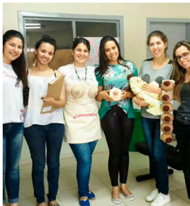
▶ Grupo de orientação ao aleitamento materno